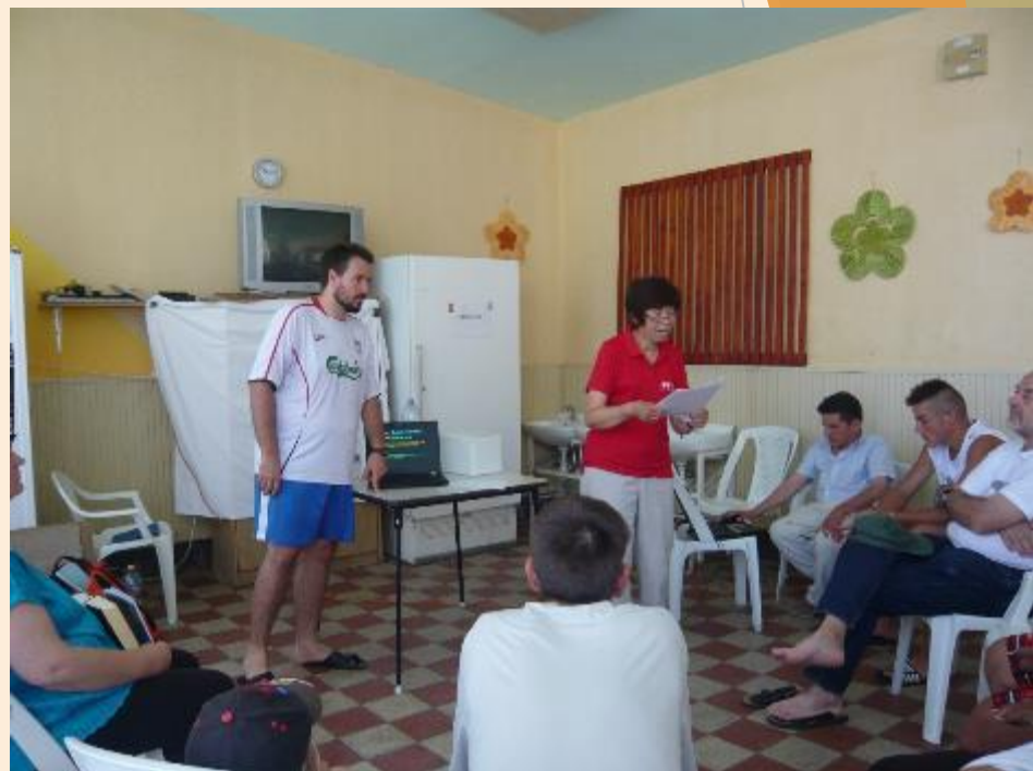
2015年7月匈牙利羅姆人 短宣服侍相片

羅姆人一直缺乏 正確的家庭觀和 婚姻觀，你願意 去分享你從聖經 中所領受的教導 嗎？