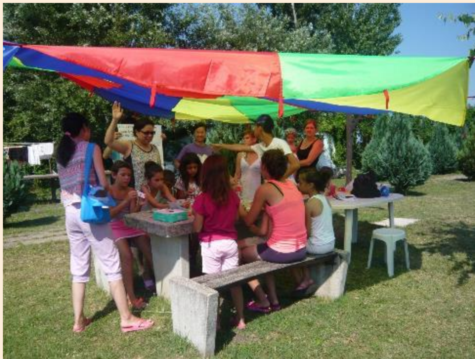
2015年7月匈牙利羅姆人短宣服侍相片